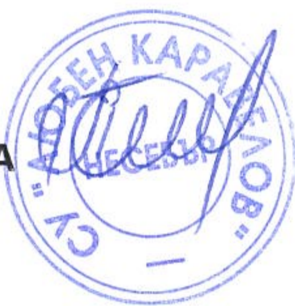
ГРАФИК ЗА ПРОВЕЖДАНЕ НА ИЗПИТИ ЗА ОПРЕДЕЛЯНЕ НА ГОДИШНА ОЦЕНКА ПО ПРЕДМЕТИ ЗА УЧЕНИЦИ В СФО – СЕСИЯ НОЕМВРИ ЗА УЧЕБНАТА 2025/2026 г.