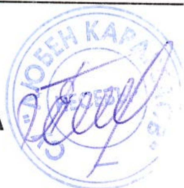
ГРАФИК ЗА ПРОВЕЖДАНЕ НА ИЗПИТИ ЗА ОПРЕДЕЛЯНЕ НА ГОДИШНА ОЦЕНКА ПО ПРЕДМЕТИ ЗА УЧЕНИЦИ В СФО – СЕСИЯ ДЕКЕМВРИ ЗА УЧЕБНАТА 2025/2026 г.