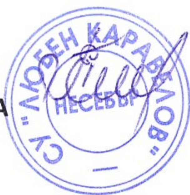
ГРАФИК ЗА ПРОВЕЖДАНЕ НА ИЗПИТИ ЗА ОПРЕДЕЛЯНЕ НА ГОДИШНА ОЦЕНКА ПО ПРЕДМЕТИ ЗА УЧЕНИЦИ В СФО – СЕСИЯ ЯНУАРИ ПРЕЗ УЧЕБНАТА 2025/2026 г.