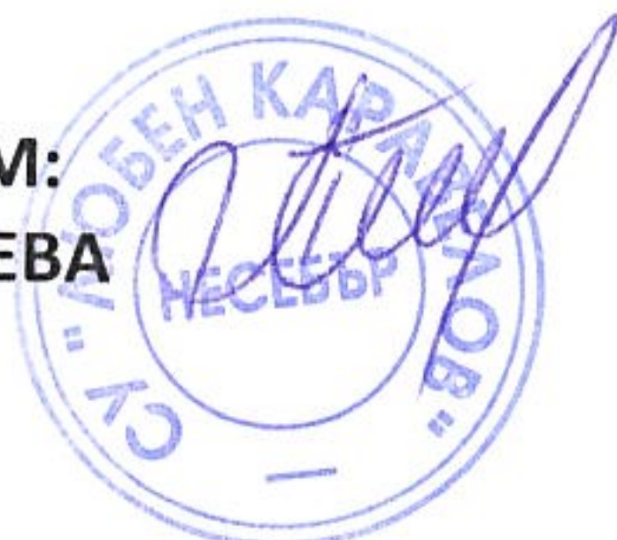
ГРАФИК ЗА ПРОВЕЖДАНЕ НА ИЗПИТИ ЗА ОПРЕДЕЛЯНЕ НА ГОДИШНА ОЦЕНКА ПО ПРЕДМЕТИ ЗА УЧЕНИЦИ В СФО – СЕСИЯ ЯНУАРИ ПРЕЗ УЧЕБНАТА 2025/2026 г.