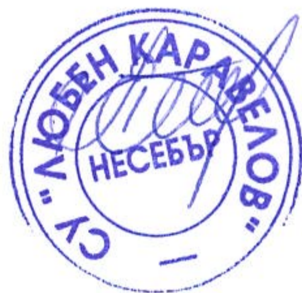
ГРАФИК ЗА ПРОВЕЖДАНЕ НА ИЗПИТИ ЗА ОПРЕДЕЛЯНЕ НА ГОДИШНА ОЦЕНКА ПО ПРЕДМЕТИ ЗА УЧЕНИЦИ СФО – СЕСИЯ МАРТ ПРЕЗ УЧЕБНАТА 2025/2026 г.