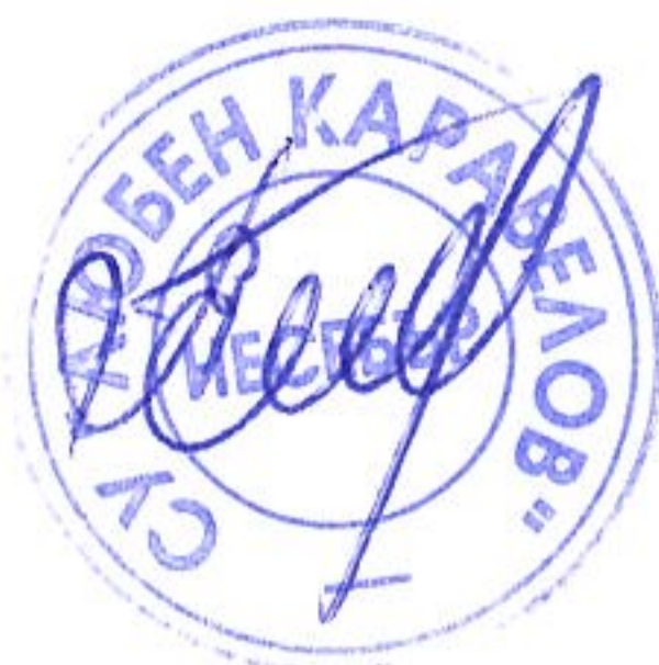
ГРАФИК ЗА ПРОВЕЖДАНЕ НА ИЗПИТИ ЗА ОПРЕДЕЛЯНЕ НА ГОДИШНА ОЦЕНКА ПО ПРЕДМЕТИ ЗА УЧЕНИЦИ СФО – СЕСИЯ АПРИЛ ПРЕЗ УЧЕБНАТА 2025/2026 г.